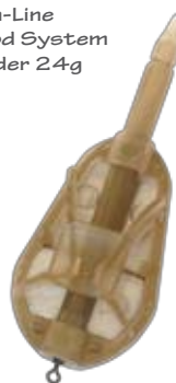
In-Line Method System Feeder 24g

Sistema In-Line che beneficia del rivoluzionario design del feeder, senza elastico! Una girella Guru Rig System Swivel dell' 11 si alloca perfettamente nel tubicino per la connessione al terminale. Se la lenza madre dovesse rompersi, il monofilo passerà attraverso il tubicino del feeder, permettendo al corpo del feeder e al tubicino di scorrere liberamente sulla lenza madre. Confezione da 1pz