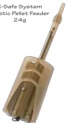
X-Safe System Elastic Pellet Feeder 24g

Sistema in line con elastico. Feeder per pellet con carico rapido, e facile rilascio dell'esca. Il design affusolato del corpo lo rende semplice da utilizzare ed offre un pratico e veloce caricamento. La forma è disegnata per trattenere i pellets nel lancio, ma rilascia l'esca quasi istantaneamente una volta sul fondo del lago. Confezione da 1pz.