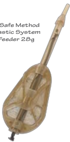
X-Safe Method Elastic System Feeder 28g

L'esclusivo X-Safe System mette fine ai montaggi con elastico bloccato, e offre tutti i benefici dell'elastico in un sistema sicuro quanto un in-line scorrevole. Realizzate un'asola alla fine della lenza madre e collegatela alla X-Safe Clip; infine, fateci scorrere sopra il Tail Rubber X-Safe. Questo vuol dire che il pesce non potrà MAI rimanere incatenato al feeder nel caso in cui si verificano rotture della lenza madre. Confezione da 1pz